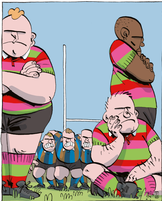
Dessin de Triton.