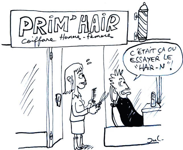
Dessin de Jul.